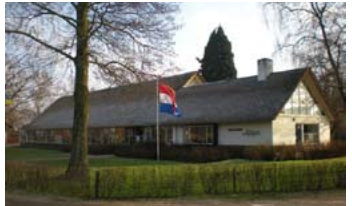
O.B.S. de Rietgors aan de Spankerenseweg

Om de huidige ambulante handel te behouden, dient men gesprekken aan te gaan met leveranciers van de diverse diensten en de partijen die voorzieningen beschikbaar stellen. Hier kan worden besproken wat er mogelijk is en welke voorwaarden er worden gesteld aan voorzieningen die behouden moeten worden.