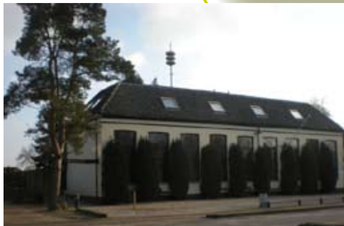
't Buurthuis aan de Arnhemsestraat

Daarnaast vervult het schoolgebouw en het omliggende terrein in het dorp een maatschappelijke functie bij activiteiten als het jaarlijkse School- en Oranjefeest, het vogelschieten, de Leuvenheimse Beekloop, het kerstfeest en de fancyfair.