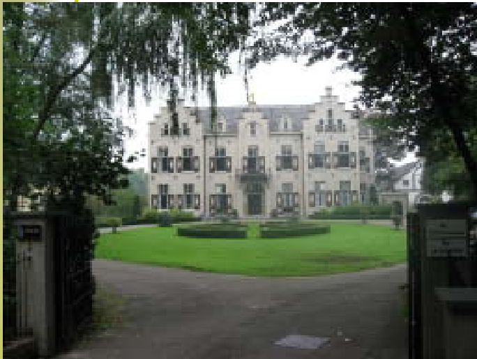
Landgoed de Wildbaan

Haaks op de noord-zuid verlopende zones liggen andere structuren: verbindingswegen zoals de Leuvenheimsestraat, een deel van de Spankerenweg, de oost-west opstreckende vormen van agrarische en bospercelen en de west-oost stromende Leuvenheimse Beek en Soerense Beek. Al die elementen tezamen vormden eeuwenlang een eenheid en een afspiegeling van de (agrarische) bestaanswijze van de Leuvenheimers.