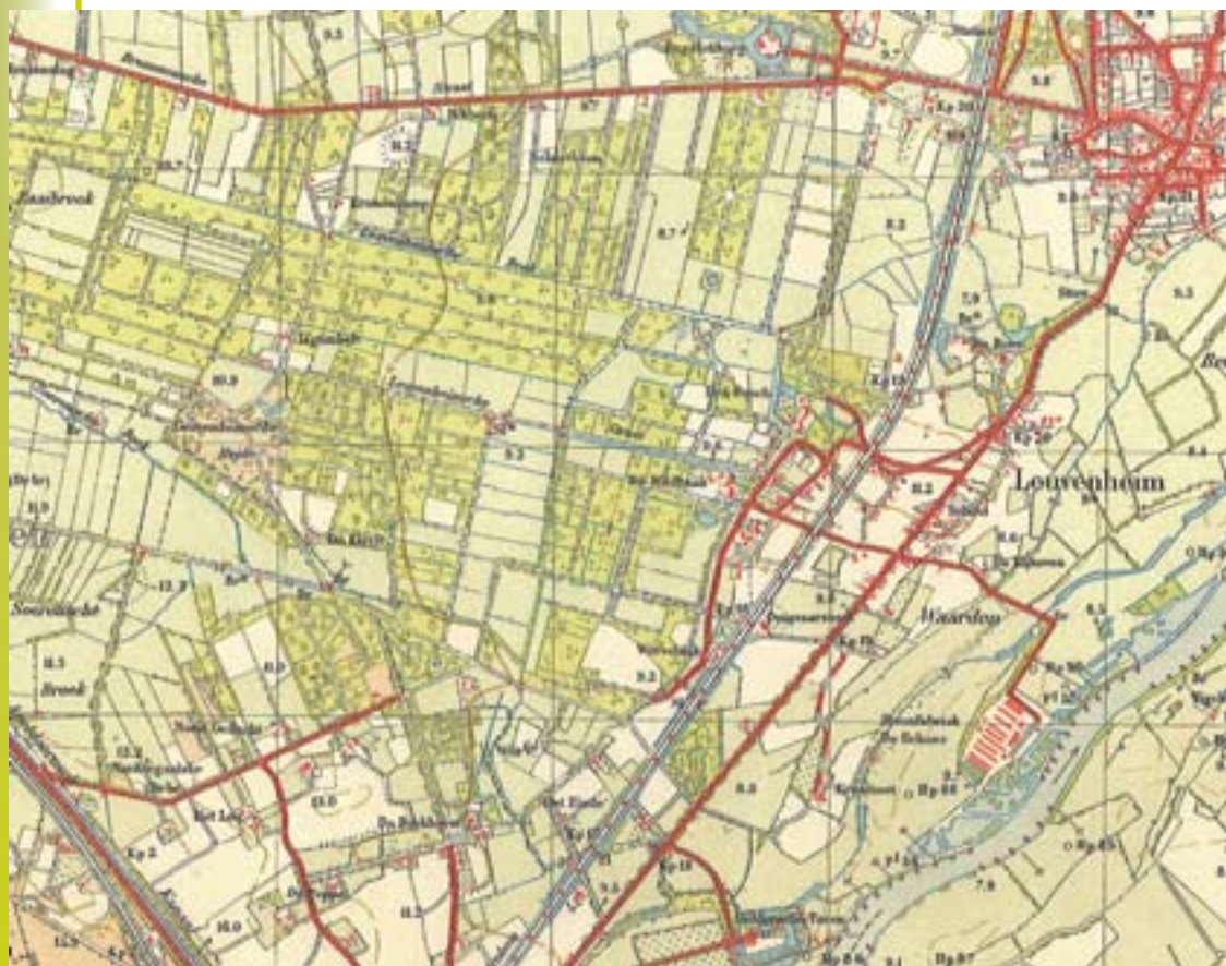
Kaart 8: Leuvenheim ca. 1907