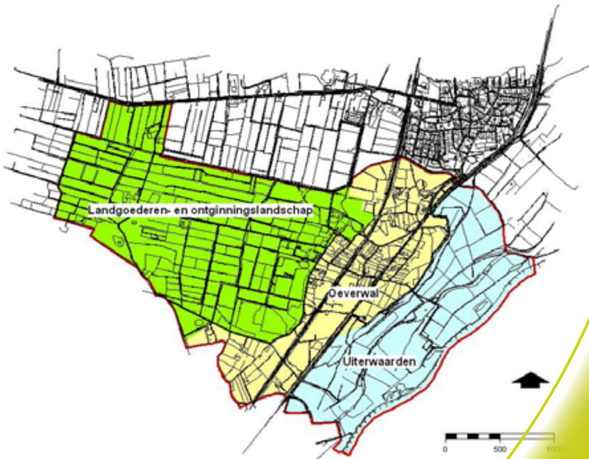
Kaart 6: de drie landschapszones

Vanaf de IJssel zijn drie noord-zuid verlopende zones te onderscheiden: de uiterwaarden, de hogere oeverwal en de lagere gronden achter de oeverwal. Die combinatie is bepalend geweest voor het ontstaan van Leuvenheim en het huidige Leuvenheimse landschap. Op de oeverwal ontstonden het dorp en de gemeenschappelijke bouwlanden, de Leuvenheimse Enk. Aan de westzijde lag de grens tussen de hogere grond van de oeverwal en de lagere gronden ter hoogte van de huidige Spankerenseweg voor de Wildbaan. Daar lag tot in de twintigste eeuw het zwaartepunt van de dorpsbebouwing met enerzijds de enk en anderzijds de woeste gronden met bos en heide. Langs die rand van de oeverwal ontstonden de landgoederen en van daaruit werd de woeste grond ontgonnen. De enk werd aan de andere zijden begrensd door het Wilgenpad (vroeger doorlopend tot de Oudeweg), de Oudeweg en De Rees. Ten oosten daarvan lag een grillig patroon van groengronden en geulen langs de IJssel.