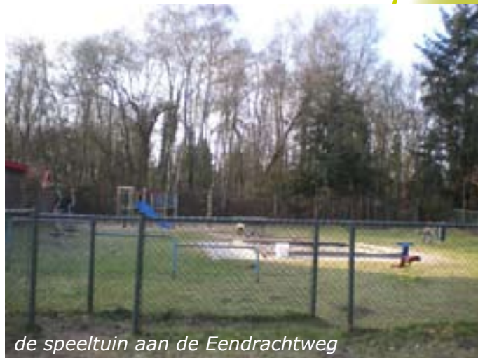
de speeltuin aan de Eendrachtweg

Ook de Maartensplaats is gehuisvest aan de Arnhemsestraat. Dit is een op antroposofische basis georganiseerde zorgboerderij voor volwassenen met een verstandelijke beperking.