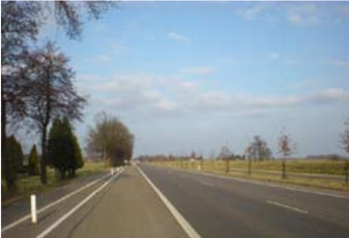
de N348 tussen Leuvenheim en Dieren