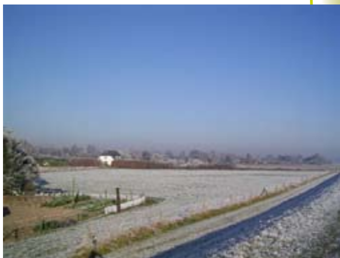
uitzicht vanaf de dijk

Men wil de natuur en het landschappelijke karakter van Leuvenheim kunnen blijven beleven aan de rivier, in de uiterwaarden, op de dijk, in het dorp, in de velden, op de akkers, in de bossen en op de moerasgronden. De N348 of een nieuwe rondweg mag daarin voor niemand een barrière vormen.