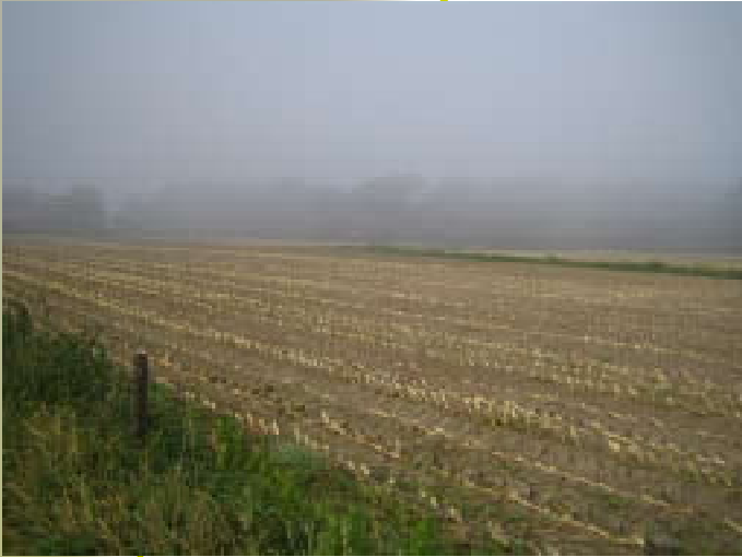
Leuvenheimse Enk op de oeverwal