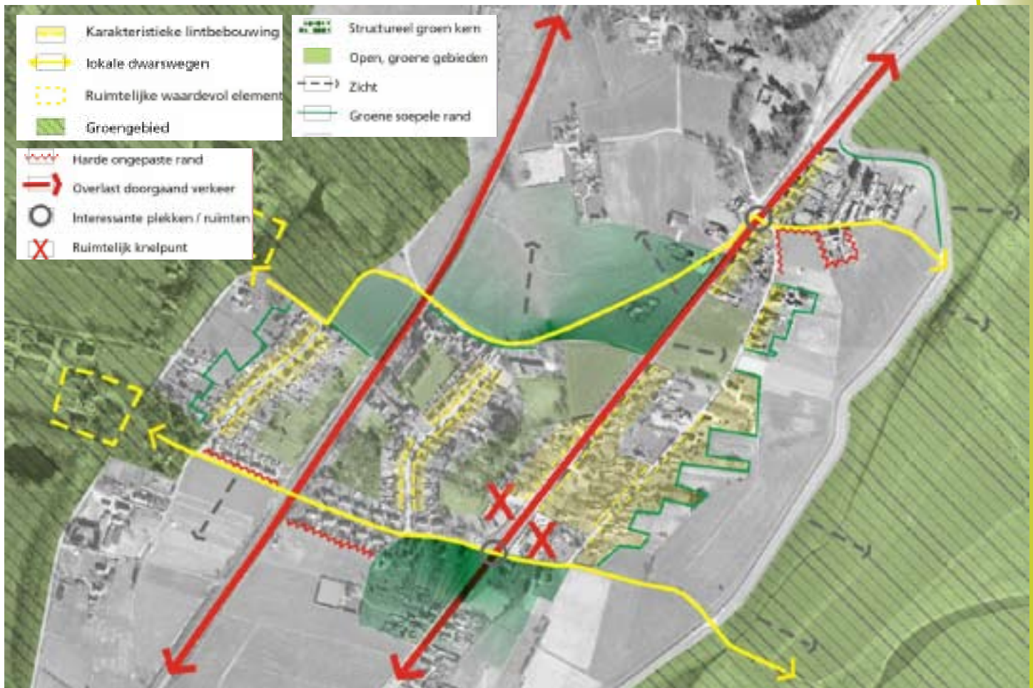
Kaart 3: ruimtelijke analyse Leuvenheim.

De burgers hadden, al dan niet naast hun boerenbedrijfje, openbare functies.