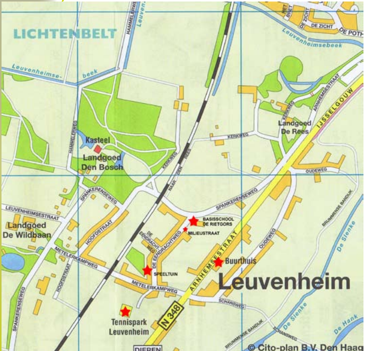
Kaart 2: plattegrond van Leuvenheim