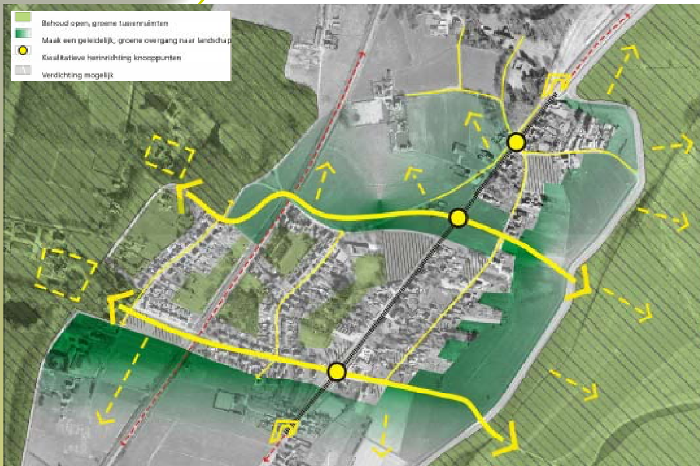
Kaart 4: mogelijke bouwlocaties Leuvenheim.