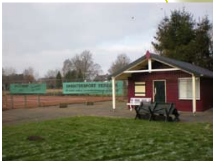
tennisbaan aan de Metelerkampweg

Tenslotte zijn er in ons dorp een aantal buurt- en/of straatverenigingen, die ervoor zorgen dat nieuwe bewoners welkom worden geheten en kennis kunnen maken met de bewoners van hun buurt door het organiseren van activiteiten zoals een fietstocht of een buurtbarbecue, één of meerdere keren per jaar.