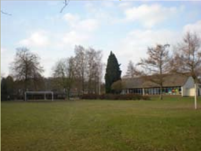
speelveld bij de Rietgors