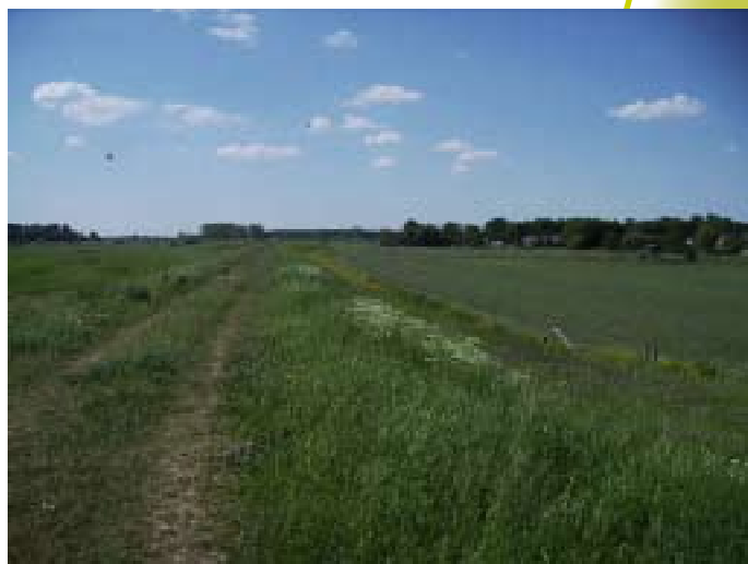
Uiterwaarden bij De Schans