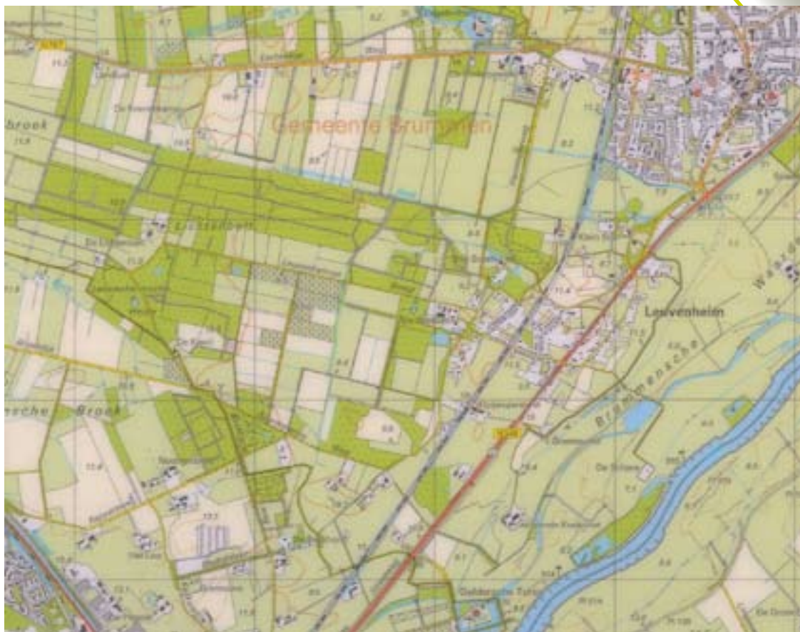
Kaart 9: Leuvenheim ca. 2007

De geschiedenis van Leuvenheim is momenteel nog in vele landschapselementen zichtbaar. De drie noord-zuid lopende zones en de bijbehorende landschappen zijn nog steeds te bewonderen: