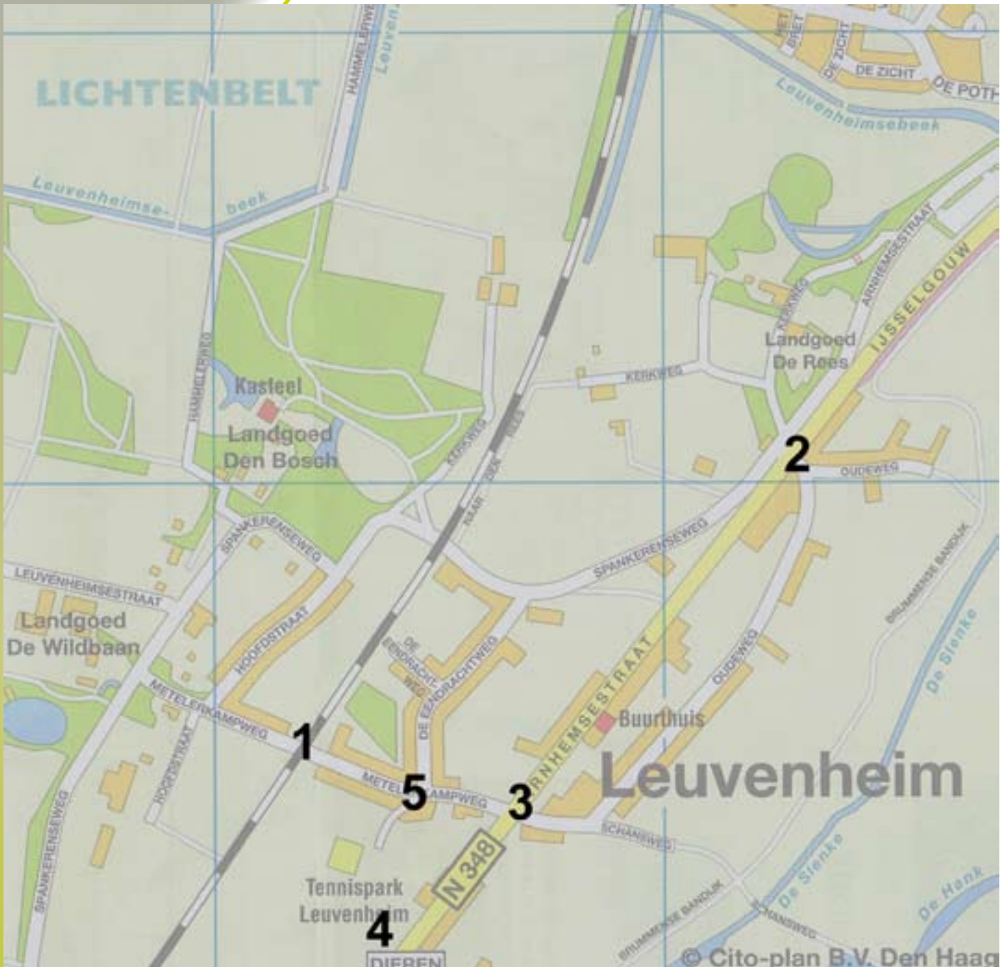
Kaart 5: locatie van de knelpunten aangegeven op de plattegrond van Leuvenheim